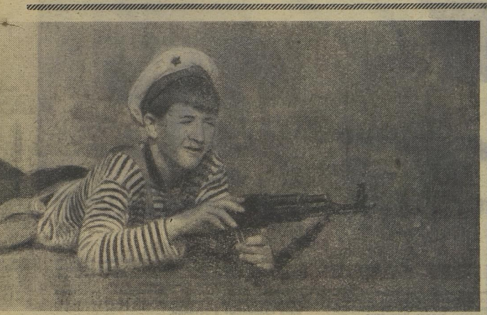
НА СНИМКАХ (слева направо):