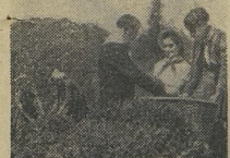
По установившейся традиции ребята Чкварельской восьмилетней школы в Грузии каждое лето помогают колхозникам убирать чайный лист. Хорошая, добрая традиция.